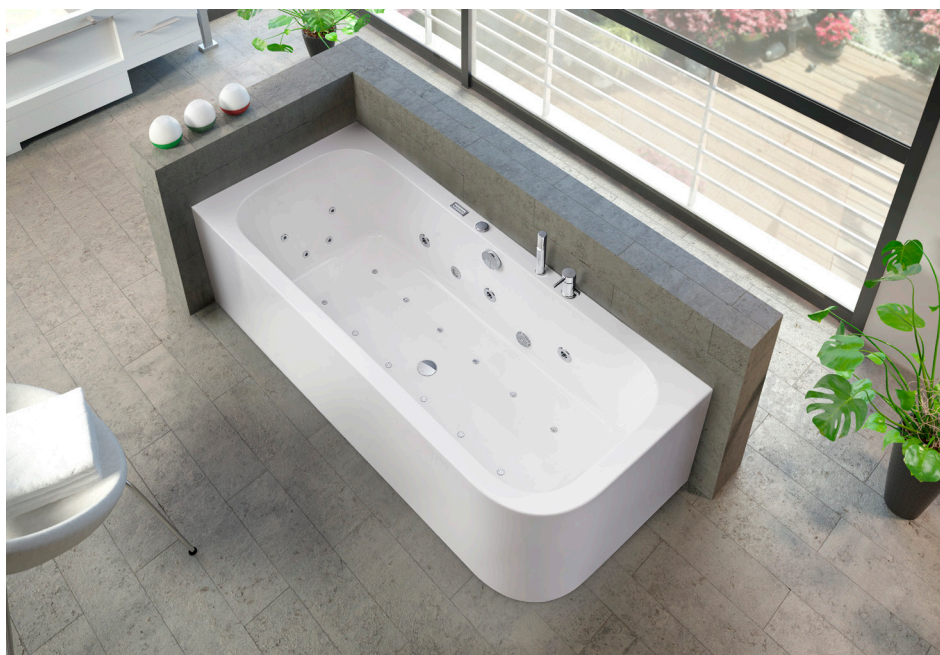
Whirlpool-Komplettsystem Spirit Modell A inkl. Wannrandarmatur S 2000