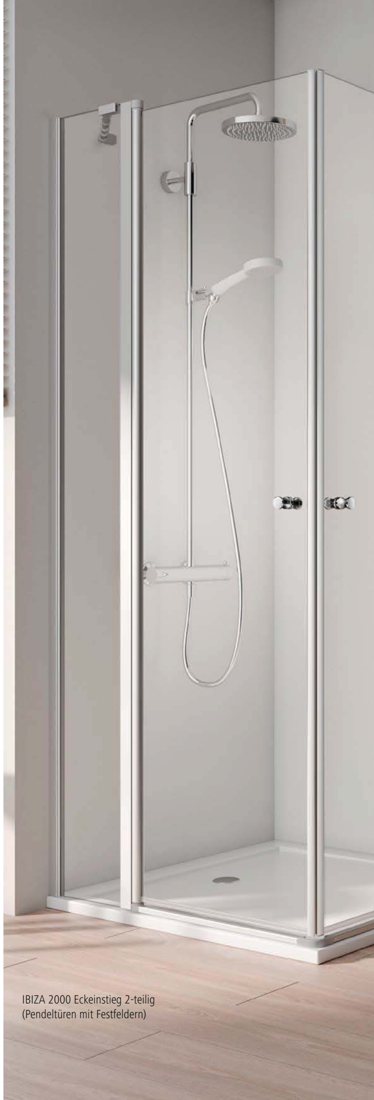
IBIZA 2000 EckEinstieg 2-teilig (Pendeltüren mit Festfeldern)