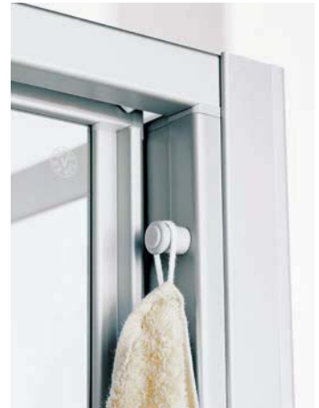
Ganz schön praktisch. Der Aufhängeknopf bei allen Faltdüren und Gleitdür 3-teilig mit Festfeld.