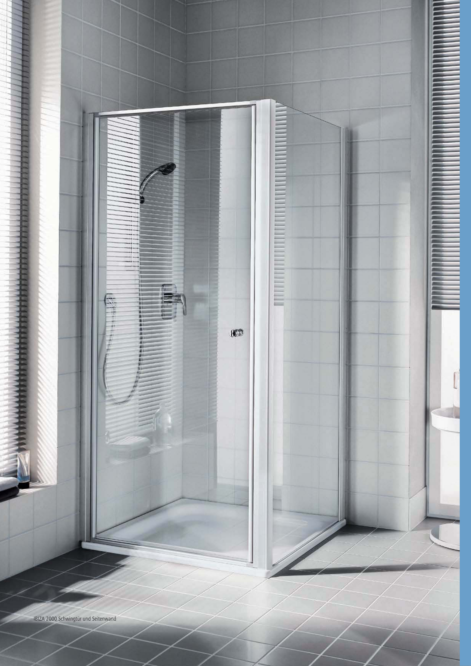
IBIZA 2000 Schwingtür und Seitenwand