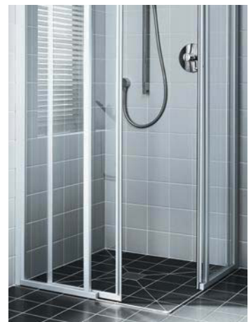
Eckeinsteig 2-teilig mit Gleitdüren auch bodenfrei erhältlich, Serienhöhe 2000 mm. Wahlweise montierbar ohne oder mit kleiner Bodenschwelle zur Verbesserung des Spritzwasserschutzes bei baulichen Gegebenheiten, auch nachträglich installierbar.