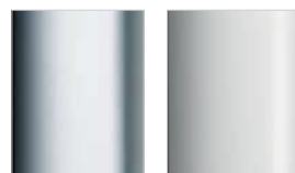
silber mattglanz weiß, RAL 9016