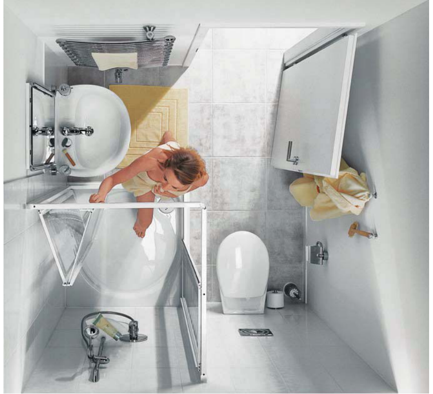
IBIZA 2000 Eckeinstieg 2-teilig (Gleit- und Falttür)