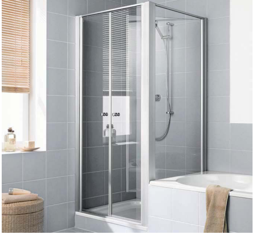
IBIZA 2000 Pendeltür und Seitenwand verkürzt beweglich neben Badewanne, geöffnet