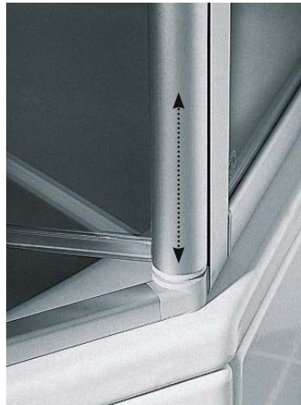
Funktionelle Feinheit: Der feinjustierbare Hebe-Senk-Mechanismus für seidenweichen Türlauf und sanften Türschluss bei allen Pendeltüren.