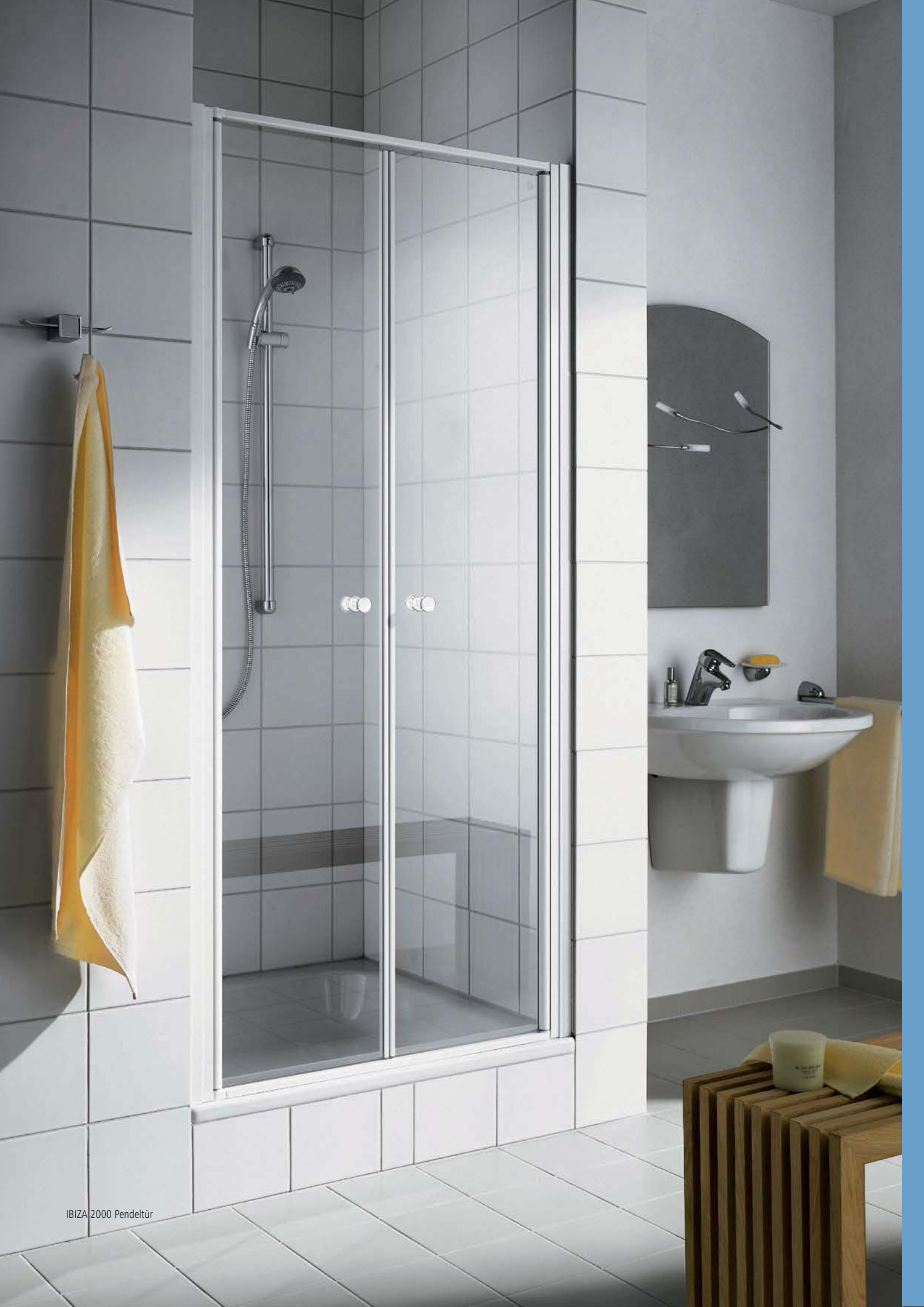
IBIZA 2000 Pendeltür