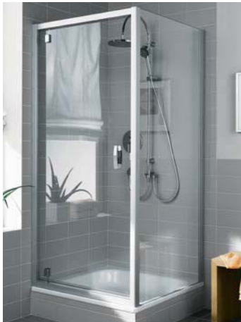
Alle Festfelder und Türflügel bei Pendel- und Schwingtüren sowie bewegliche Seitenwände waagrecht ungerahmt, Schwingtürflügel mit versetztem Drehpunkt komplett ungerahmt.