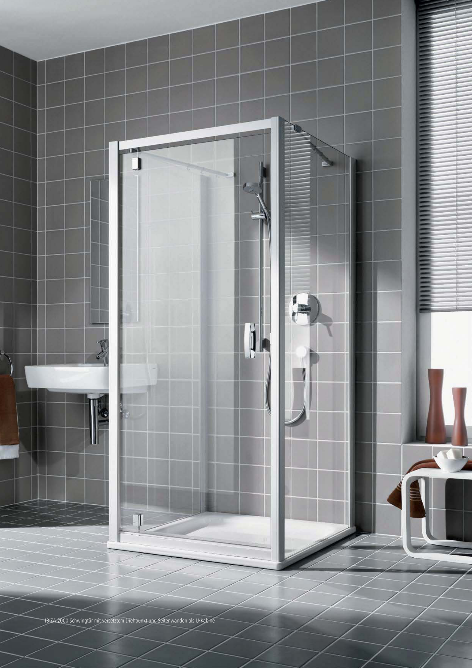
IBIZA 2000 Schwingtür mit versetztem Drehpunkt und Seitenwänden als U-Kabine