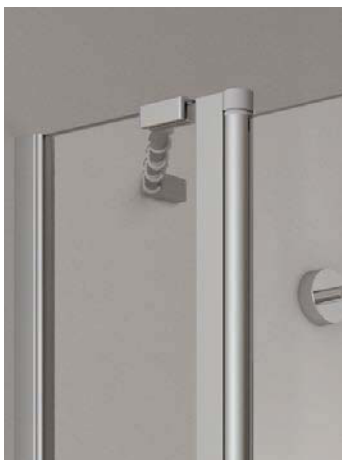
Pendel- und Schwingtürfestfelder mit schicker IBIZA-Stabilisation mit Zusatzfunktion. Zum griffbereiten Aufhängen der Duschutensilien.