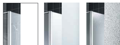
ESG klar ESG SR Opaco ESG SR Arena C

Optional mit Pflegeleicht-Beschichtung Kermi CLEAN erhältlich