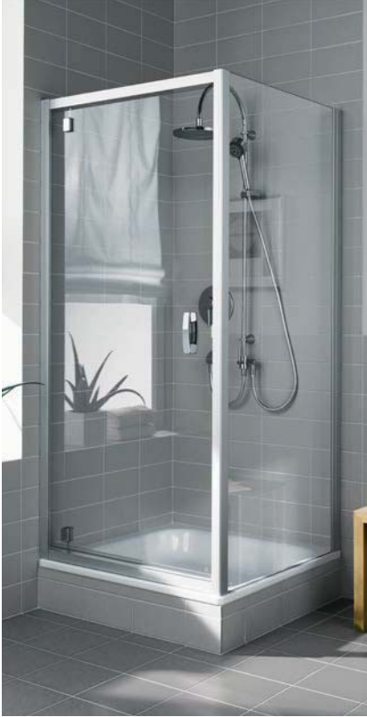
IBIZA 2000 Schwingtür mit versetztem Drehpunkt und Seitenwand