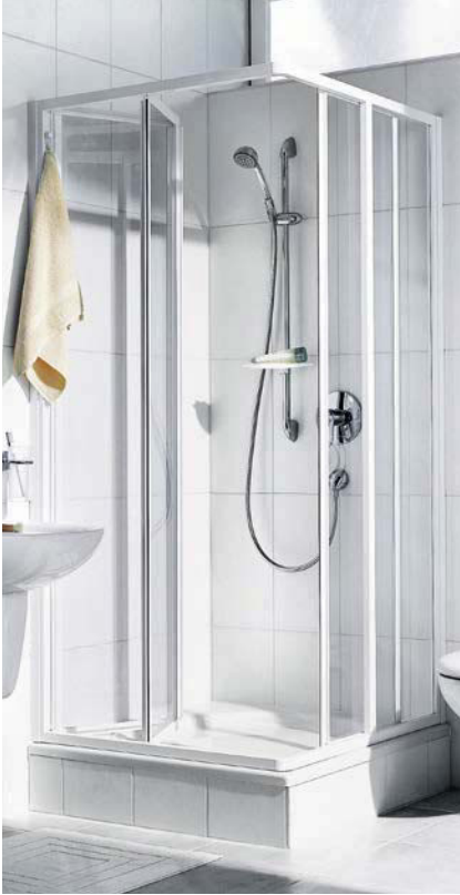
IBIZA 2000 Eckeinstieg 2-teilig (Gleit- und Falttür), geöffnet