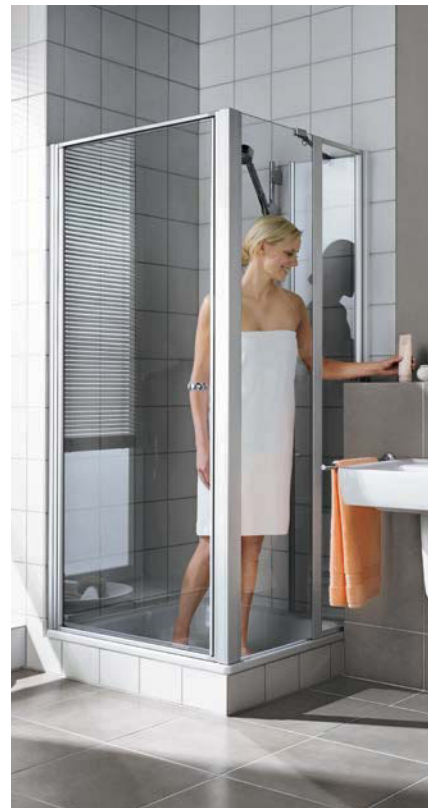
IBIZA 2000 Schwingtür und Seitenwand geteilt beweglich, geöffnet