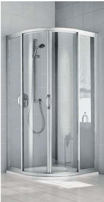
IBIZA 2000 Viertelkreis-Duschkabine (Gleittüren)