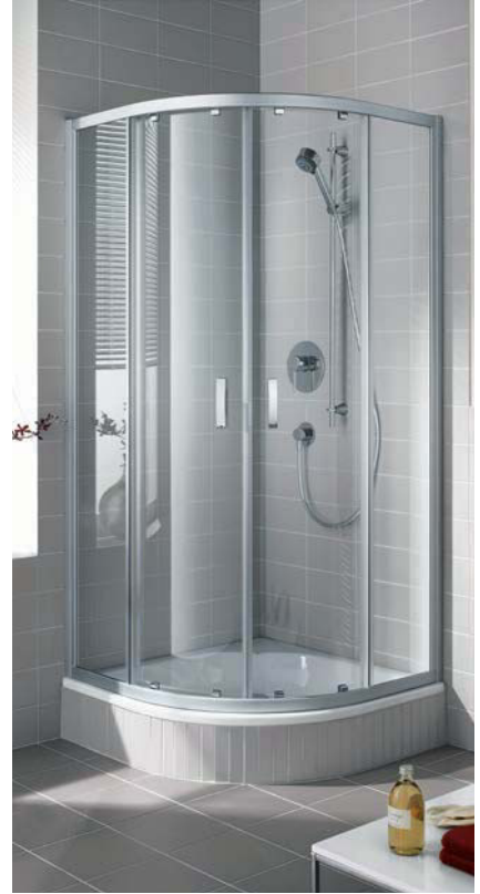
IBIZA 2000 Viertelkreis-Duschkabine teilgerahmt (Gleittüren)