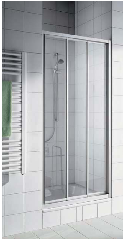
IBIZA 2000 Gleittür 3-teilig, beidseitig öffnend