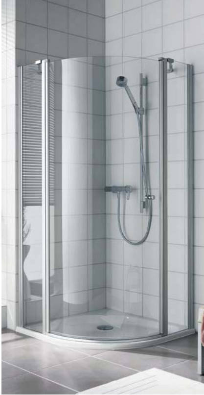
IBIZA 2000 Viertelkreis-Duschkabine (Schwingtür mit Festfeldern)