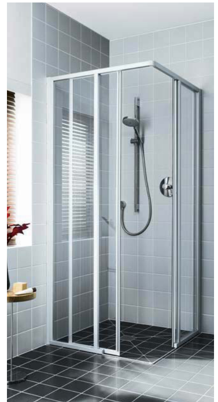
IBIZA 2000 Eckeinstieg 2-teilig bodenfrei (Gleittüren), geöffnet, mit Duschplatz POINT