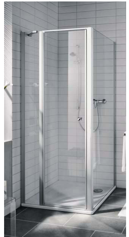
IBIZA 2000 Schwingtür mit Festfeld und Seitenwand