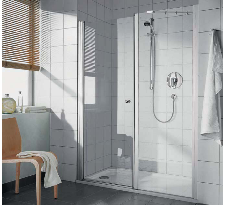
IBIZA 2000 Schwingtür und Festfeld