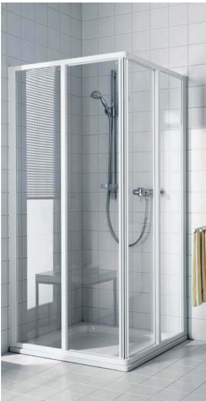
IBIZA 2000 Eckeinstieg 2-teilig (Gleittüren)