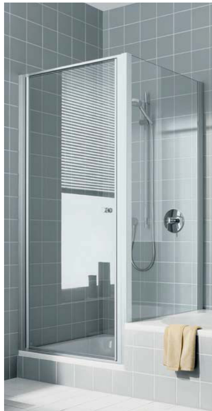
IBIZA 2000 Schwingtür und Seitenwand verkürzt auf Badewanne