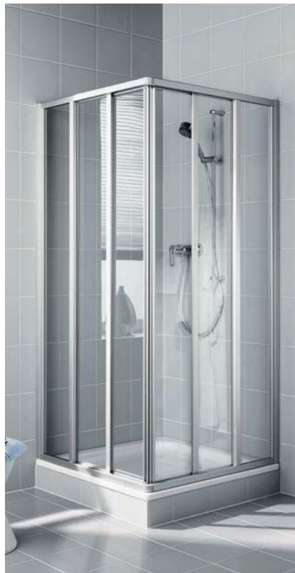
IBIZA 2000 Eckeinstieg 3-teilig (Gleittüren)