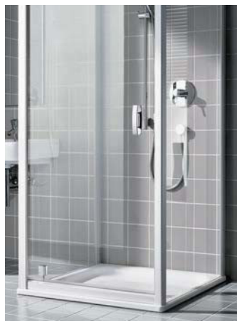
Alle Pendel- und Schwingtüren mit 16 mm hoher Bodenschwelle, Schwingtür mit versetztem Drehpunkt und alle Faltdür- und Gleitdüren mit Bodenprofil als zuverlässiger Spritzwasserschutz.