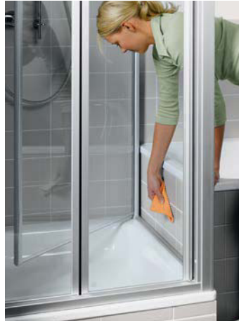
Drei patentierte bewegliche Seitenwände als Serienteil statt Maßanfertigung. Für problemlose Reinigung und optimale Entlüftung ganz oder teilweise nach innen schwenkbar.