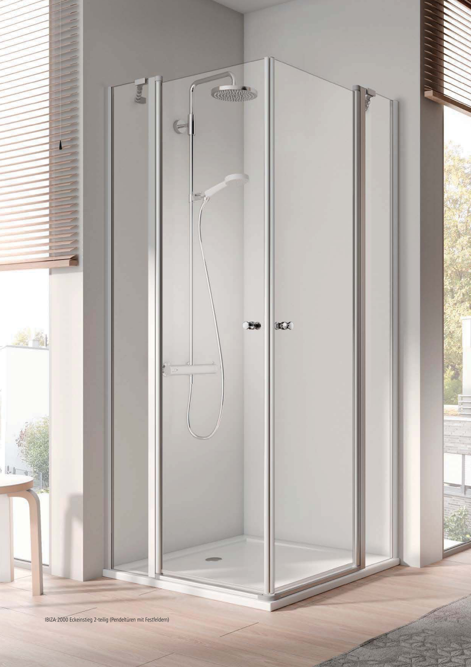
IBIZA-2000 EckEinstieg 2-teilig (Pendeltüren mit Festfeldern)