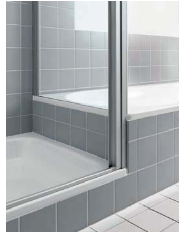
Eine feststehende Seitenwand und eine feststehende Seitenwand verkürzt auf Badewanne zur beliebigen Kombination mit allen Bauformen für Ecke und U-Kabine.