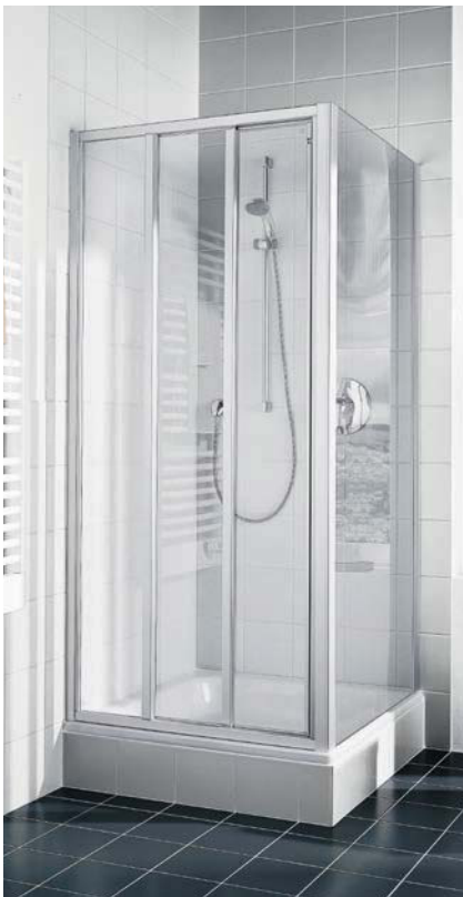
IBIZA 2000 Gleittür 3-teilig mit Festfeld und Seitenwand