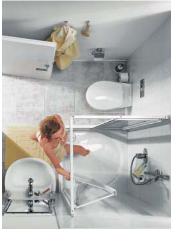
Eckeinsteigs-Gleit-Faltdürkombination für maximale Einstiegsfreiheit im kleinen Bad, alle Bauformen mit Gleit- und Faltdürfunktion rechts und links verwendbar.