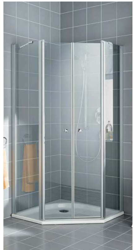
IBIZA 2000 Fünfeck-Duschkabine (Pendeltüren mit Festfeldern)