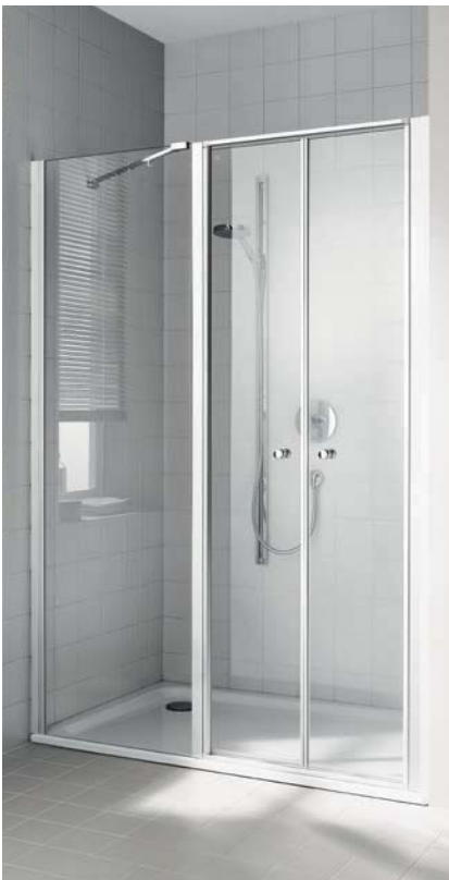
IBIZA 2000 Pendeltür mit Festfeld