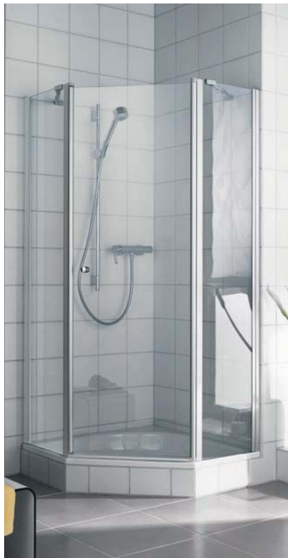
IBIZA 2000 Fünfeck-Duschkabine (Schwingtür mit Festfeldern)