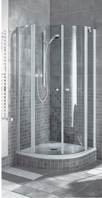
IBIZA 2000 Viertelkreis-Duschkabine (Pendeltüren mit Festfeldern)