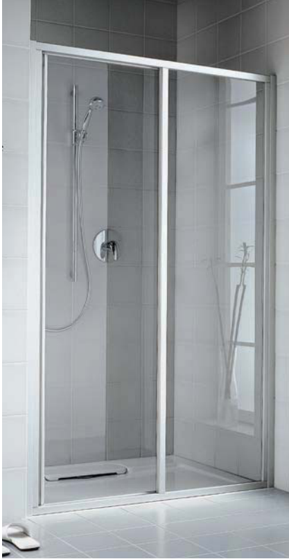
IBIZA 2000 Gleittür 2-teilig mit Festfeld